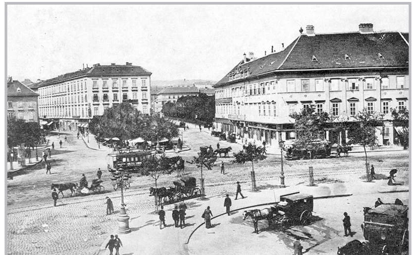
Пешта 80-тих година XIX века

Занимљиво је да се скуп није могао одржати у Новом Саду, где су мађарске власти завеле принудну управу, пошто је Милетић по други пут 1867. године био изабран за градоначелника Српске Ати-не. Популарност и омиљеност у народу,